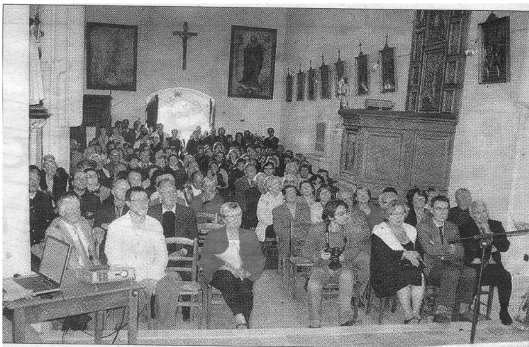
Soirée inaugurale de la commémoration dans l'église de Saint-Médard de Barbezieux, lieu de naissance d'Élie Vinet.