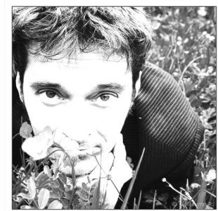
ZED VAN TRAUMAT