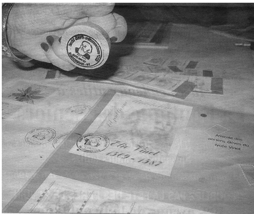
L'amicale des anciens élèves a fait émettre un timbre Élie Vinet, mais aussi un tampon à date du 16 mai pour l'occasion unique.