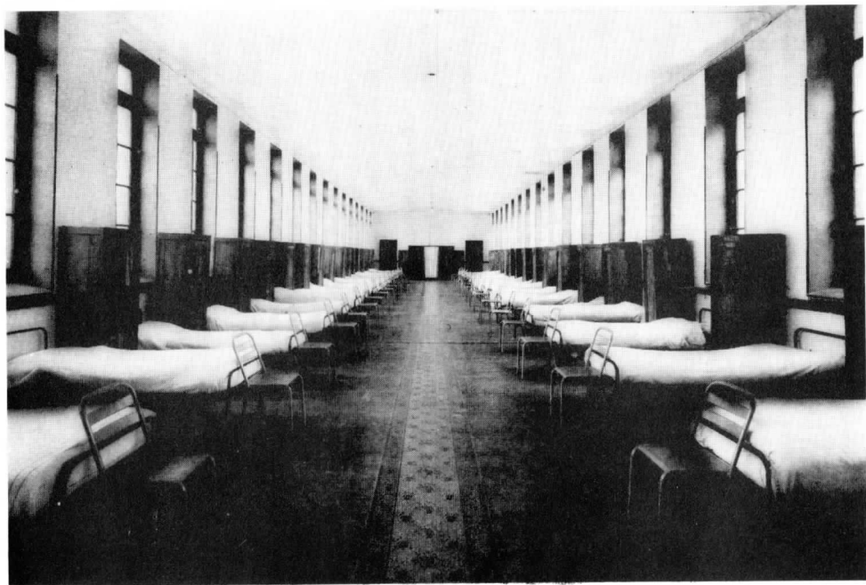
Le dortoir du « BAHUT » garçons en 1945...