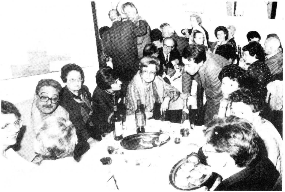
« LES RETROUVAILLES » du 27 MARS 1982.