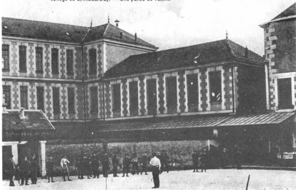
Collège de BARBEZIEUX — Une partie de Tennis

Crédit Agricole Banque Populaire Crédit Commercial de France Crédit Mutuel