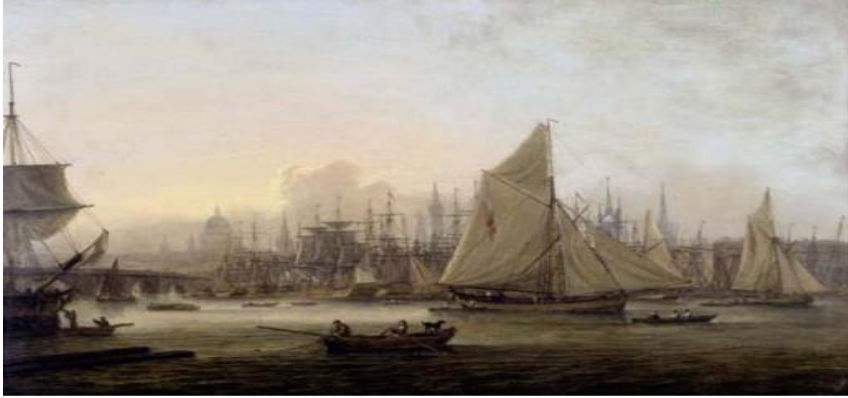
Le pool of London, vers 1810, peinture de Thomas Luny

Pourquoi les docks de Londres ont-ils été construits à partir de 1800 ?