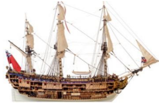
Falmouth, navire des Indes Orientales

Quel fut le rôle du commerce des Antilles dans le développement des docks ? Sucre, café et rhum des Antilles constituent le quart des importations vers 1800 et le rhum doit être passé en douane avant 30 jours, sinon il est confisqué.. La compagnie des Indes Occidentales (= Antilles = Caraïbes) se fonde pour gérer le dock, avec un monopole absolu : tout navire des Antilles ne peut accoster que là, et aucun autre. (jusqu'en 1824). D'autres docks fermés sont donc construits.